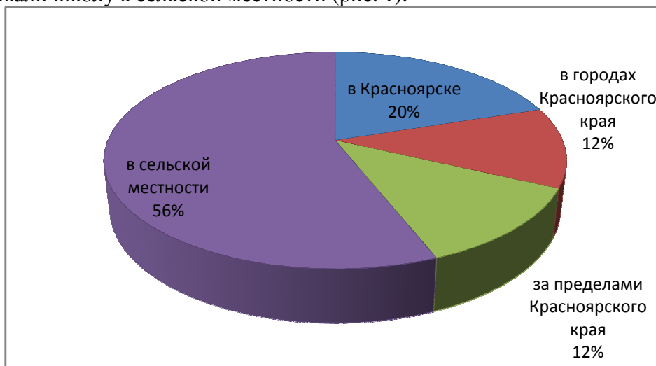
Рисунок 1- Где студенты оканчивали школу

В анкетировании приняло участие двадцать пять первокурсников Института педагогики психологии и социологии по специальностям социология и PR. По результатам анкет 100% студентов было женского пола. 20% из них оканчивали школу в городе Красноярске, 12% в городах Красноярского края, 12% выпускники школ за пределами Красноярского края и 56% оканчивали школу в сельской местности (рис. 1).