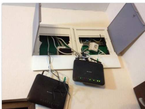
Good spot for the wifi

Simon Stanleigh @Stanleigh77 #sochi good news, I have Internet, bad news, it's dangling from the ceiling in my room... 12:14 PM - 2 Feb 2014