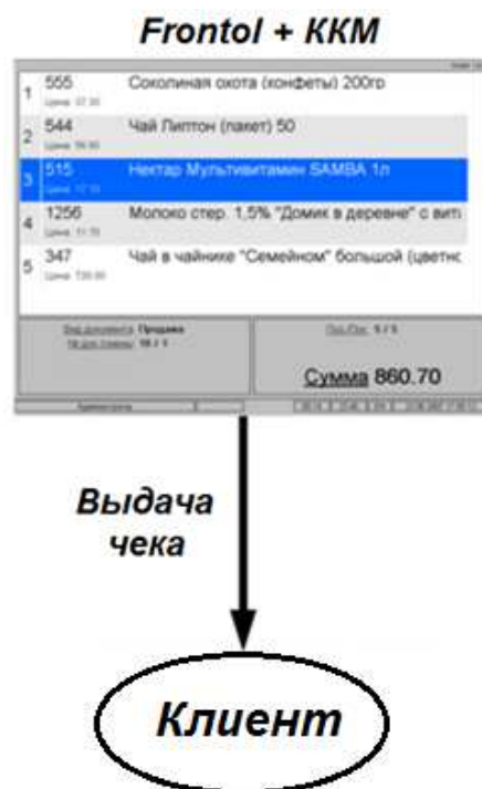
Рис. 1 – Принцип работы программного обеспечения Frontol WinCE

Однако, база данных Frontol не содержит информации о поступлении и реализации продукции, а также об остатке продукции. То есть, база позволяет облегчить процесс оформления операции по реализации продукции, снизить риски неверного отражения цены, существующие при полностью ручном вводе информации, выдать чек покупателю. При этом работа в этой базе данных не дает возможности оперативного учета имеющихся товаров, их остатка, не позволяет строить формы отчетности, которая должна вестись на торговой точке. Таким образом, могут возникать недочеты, вызванные невнимательностью персонала торговых точек на фоне повышения загруженности и увеличения объемов работ (при подсчете единиц продукции в ходе инвентаризации, при расчетах с покупателями и в других случаях). Также нередко встречаются факты хищения продукции, так как программное обеспечение Frontol не дает возможности фиксировать остаток отдельных единиц продукции на торговой точке, что дает возможность для хищения.