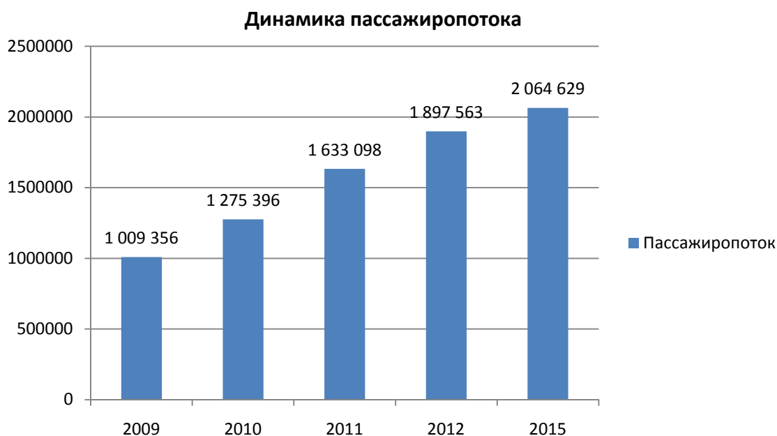
График 1 – Динамика пассажиропотока аэропорта Емельяново в разрезе 5 лет, млн. чел.