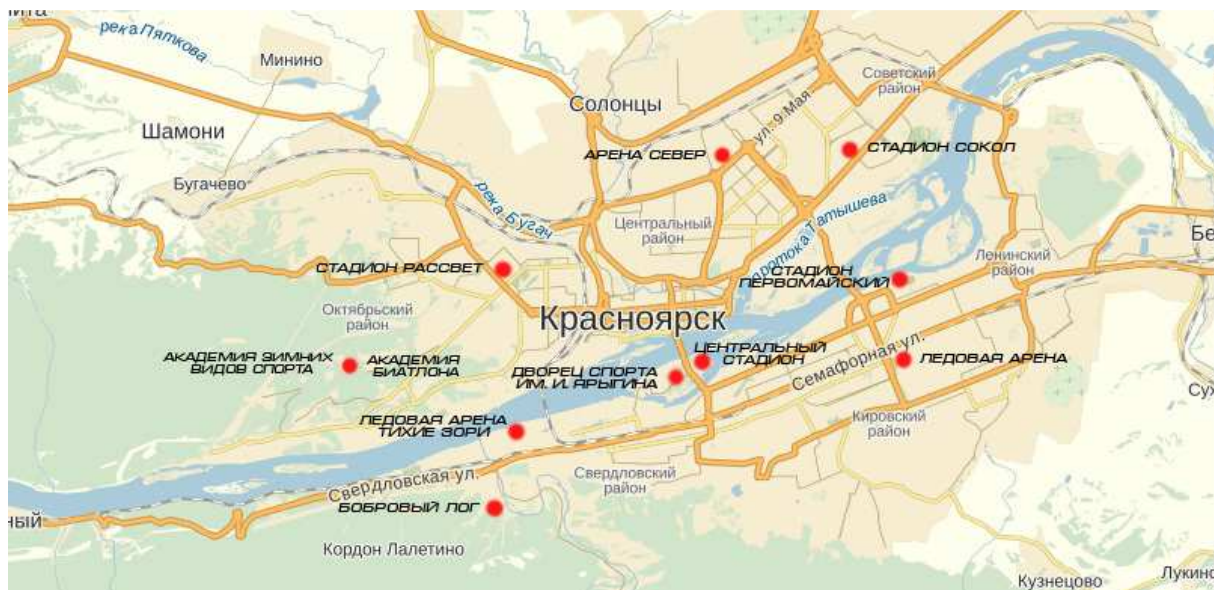
Рисунок 2 – места расположения спортивных объектов, задействованных в Универсиаде 2019 г.

Таким образом, сопоставив расположение спортивных объектов и участки дорог города, на которых часто возникают затруднения, предлагаются 2 возможных места установки магистралей-эстакад: участок по ул. Брянская, в районе Брянского кольца, протяженностью 1000 метров; участок по ул. Авиаторов, на отрезке между улицами Молокова и 9 Мая, протяженностью 1000 метров.