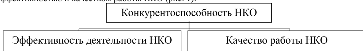
Рисунок. 1 Содержание конкурентоспособности НКО

Исходное содержание конкурентоспособности НКО определяется эффективностью и качеством работы НКО (рис. 1).