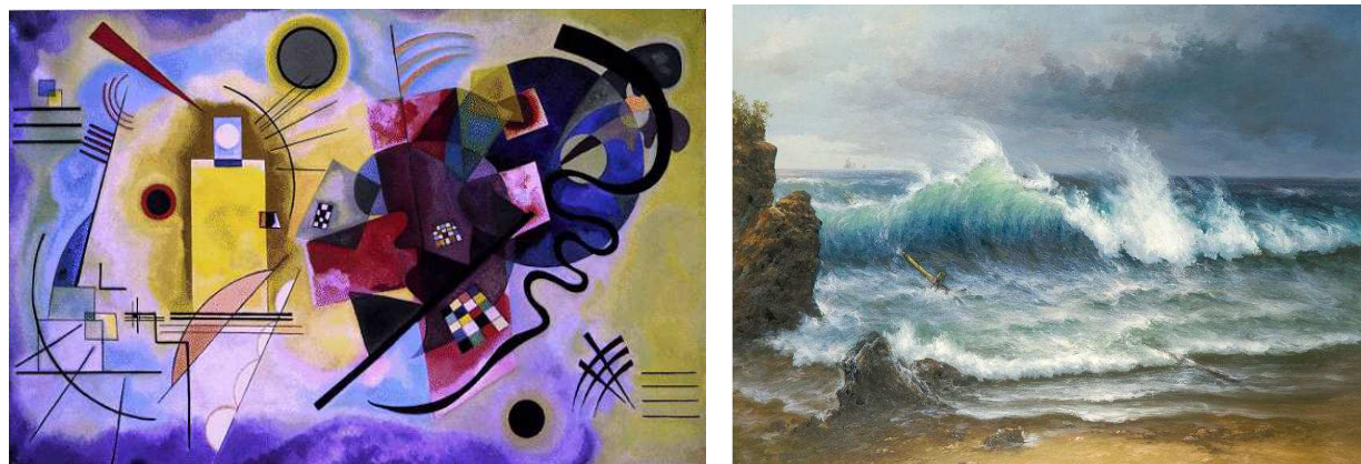
Рисунок 2 – Картина в стиле «абстракционизм». Рисунок 3– Картина в стиле «реализм».

На последнем этапе исследования студентам были предложены для выбора две картины: одна в стиле «реализм», другая – в стиле «абстракционизм» (рисунки 2, 3).