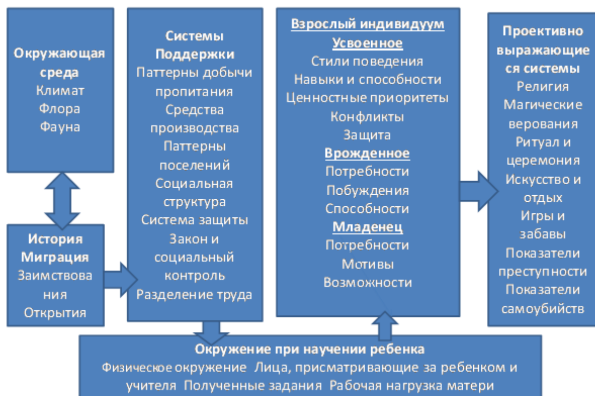
Рисунок 2. Модель психокультурного исследования по Уитингу

Модель Уитинга в интерпретации Дж. Берри изображена (рис.2). Данная модель построена на идее о том, что базовым процессом для формирования этнической идентичности являются практики воспитания ребенка , которые в свою очередь, преобразуются в культурные результаты и моделируют личность, выступающую базовой для данного этноса. Эта модель является наиболее современной из ряда разработанных моделей, разработанных в современной психологической антропологии и предназначенных для ориентации исследований личности и ее отношения к культуре.